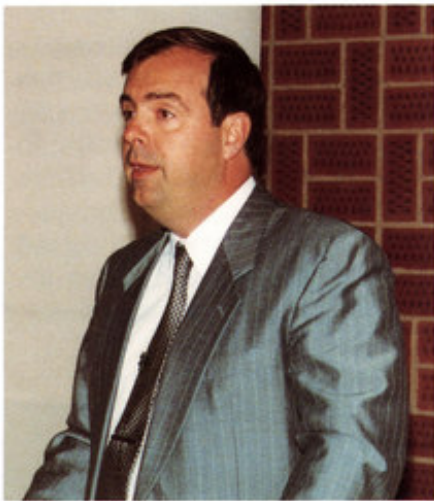
Dir. Claus Erik Christoffersen, DDE

Med de nye maskiner, med op til otte RISC-processorer fra MIPS, er det første spadestik taget for DDE i ACE-samarbejdet (Advanced Computing Environment).