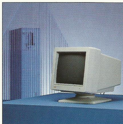
RC949 er en 14" papirhvid hovedskærm

Alle arbejdspladsmoduler kan indstilles efter individuelle ønsker. RC942 farveskærmen overholder de skandinaviske normer med hensyn til såvel lavfrekvent magnetisk udstråling som statisk elektrisk felt.