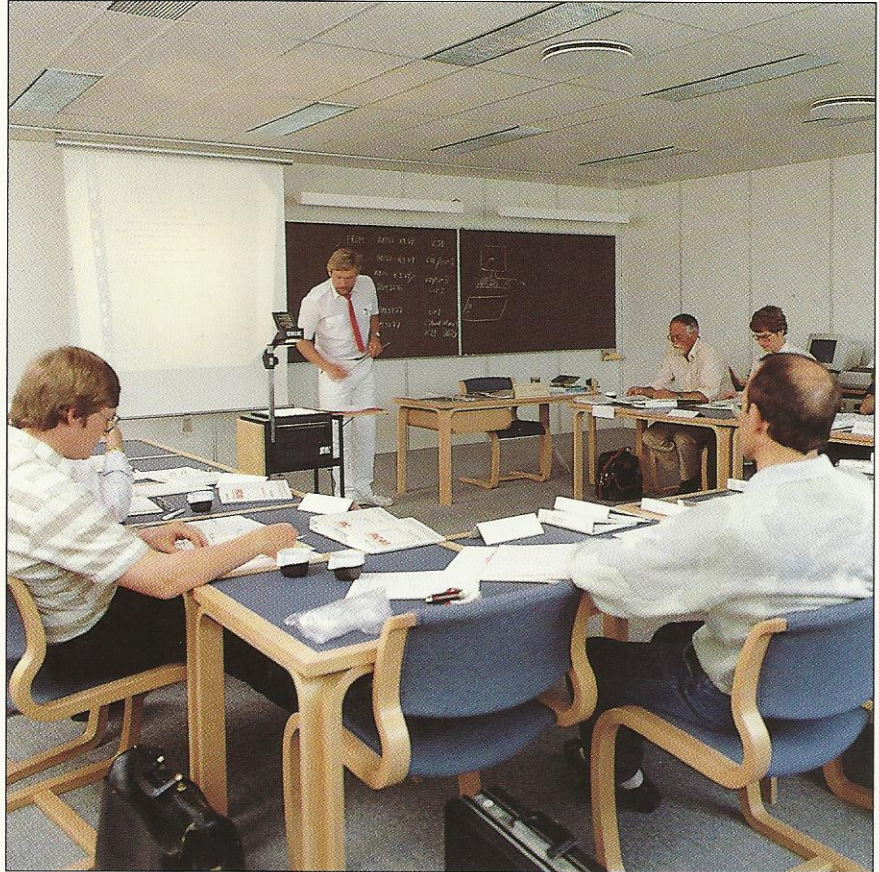
Regnecentralens uddannelsescenter kan hjælpe med at tilrettelægge uddannelsesprogrammer

Programmet BETTY giver via RC900 adgang til asynkron terminal kommunikation med andet EDB udstyr over hele verden.