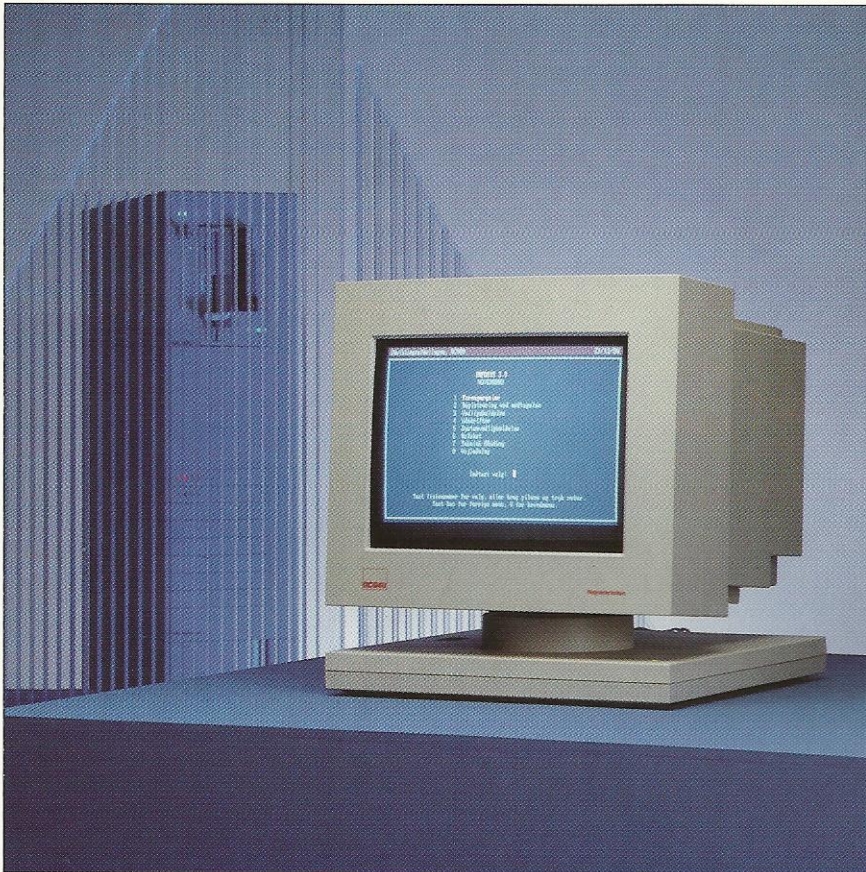
RC940 og RC942 er 15" farveskærme