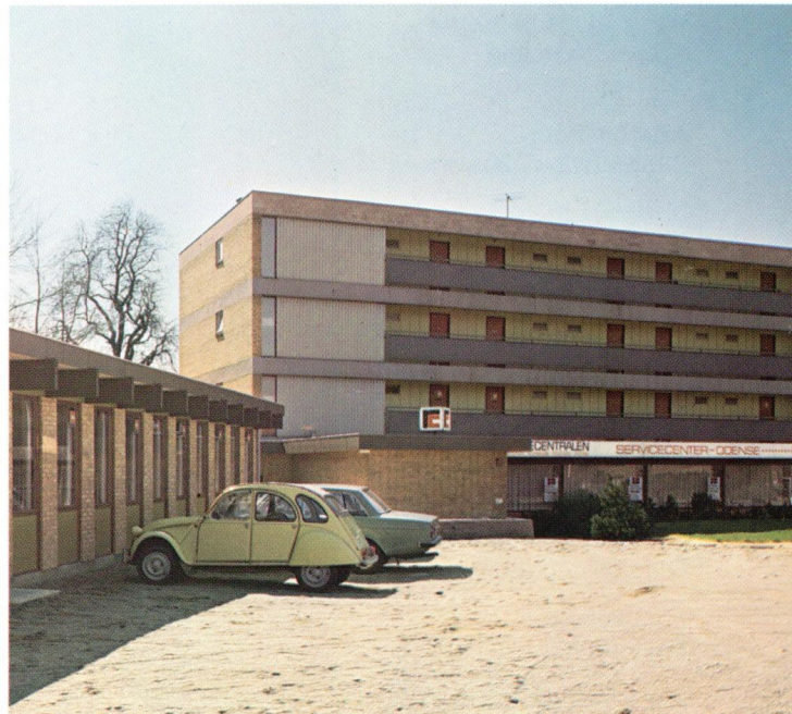
Servicecentret i Odense er blevet udvidet og moderniseret. The service bureau in Odense has been enlarged and modernized.