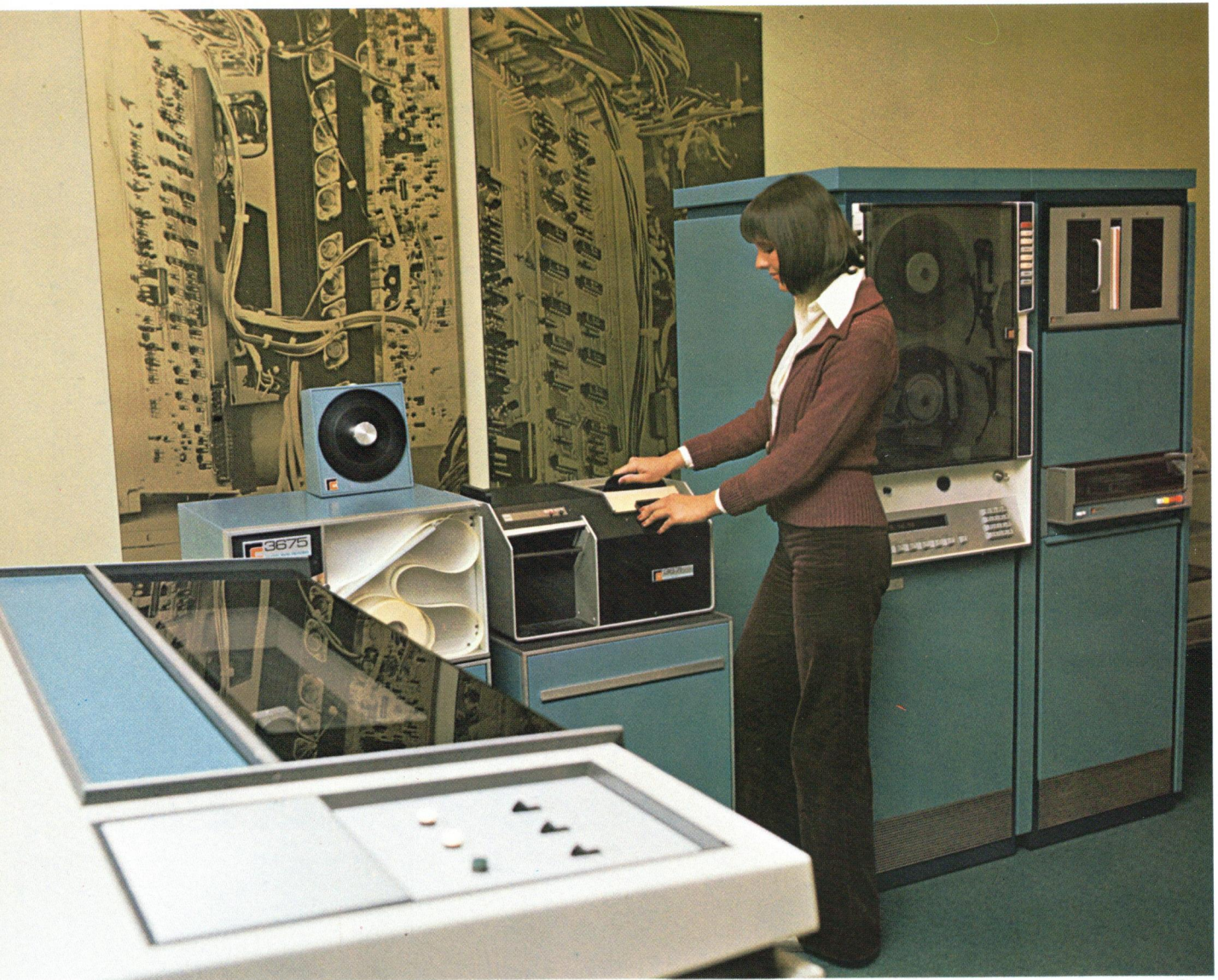
RC 3600 er et fleksibelt dataregistrerings- og kommunikationssystem. The RC 3600 is a versatile data entry and communications system.