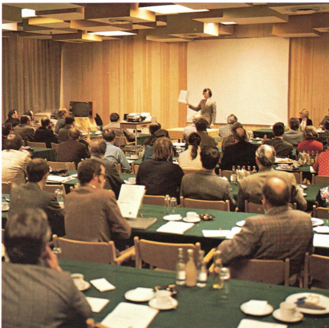
Fra et af RC's orienteringsmøder. From one of RC's information meetings.