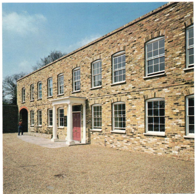
Det nyoprettede datterselskab i England. The recently established subsidiary in the U.K.