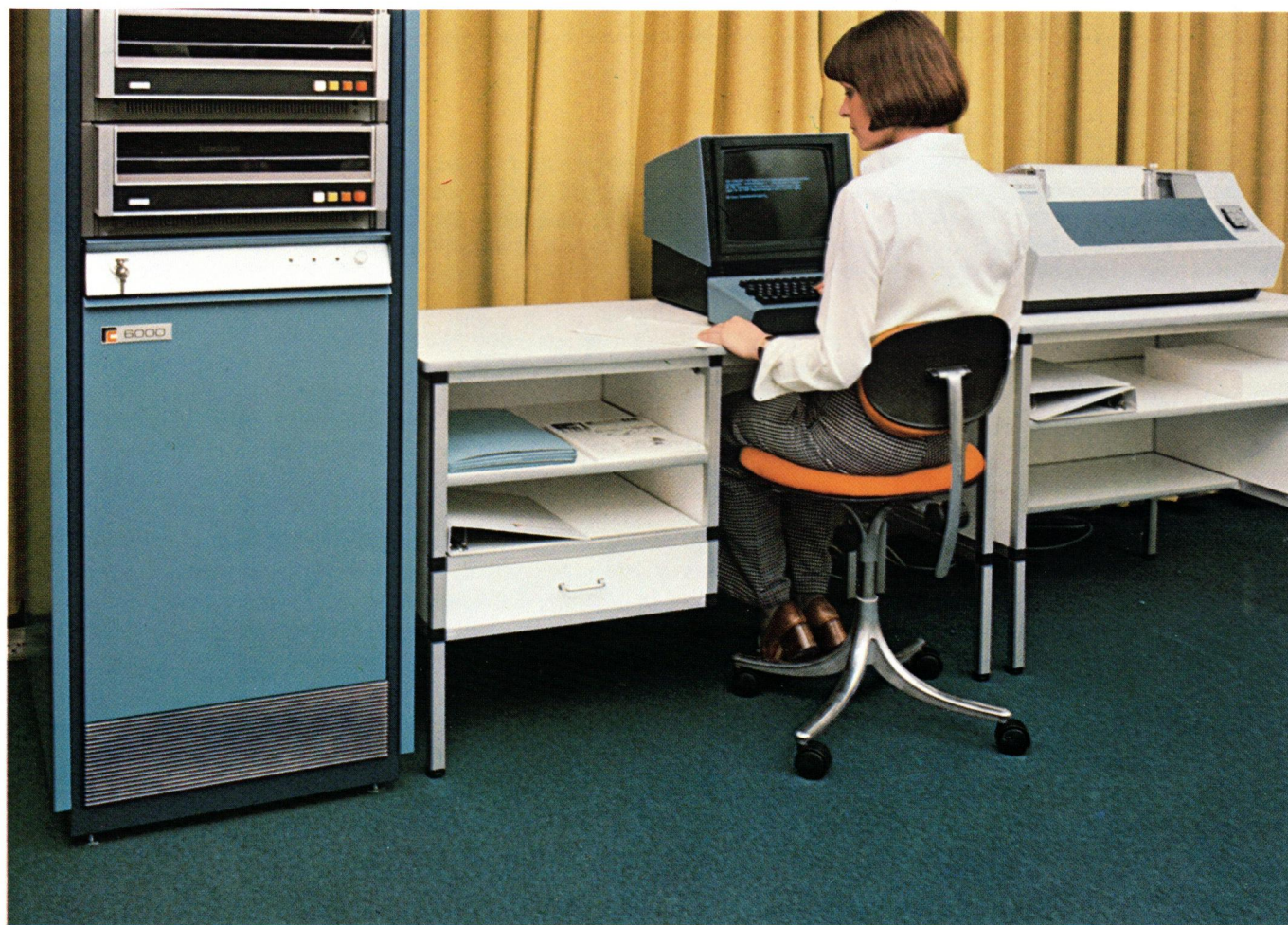
Regnecentralens nye minidatamat RC 6000. RC 6000 – Regnecentralen's new minicomputer.