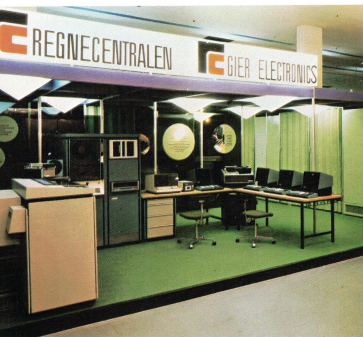
RC's stand på Hannover Messen. RC's stand at the Hannover Fair.