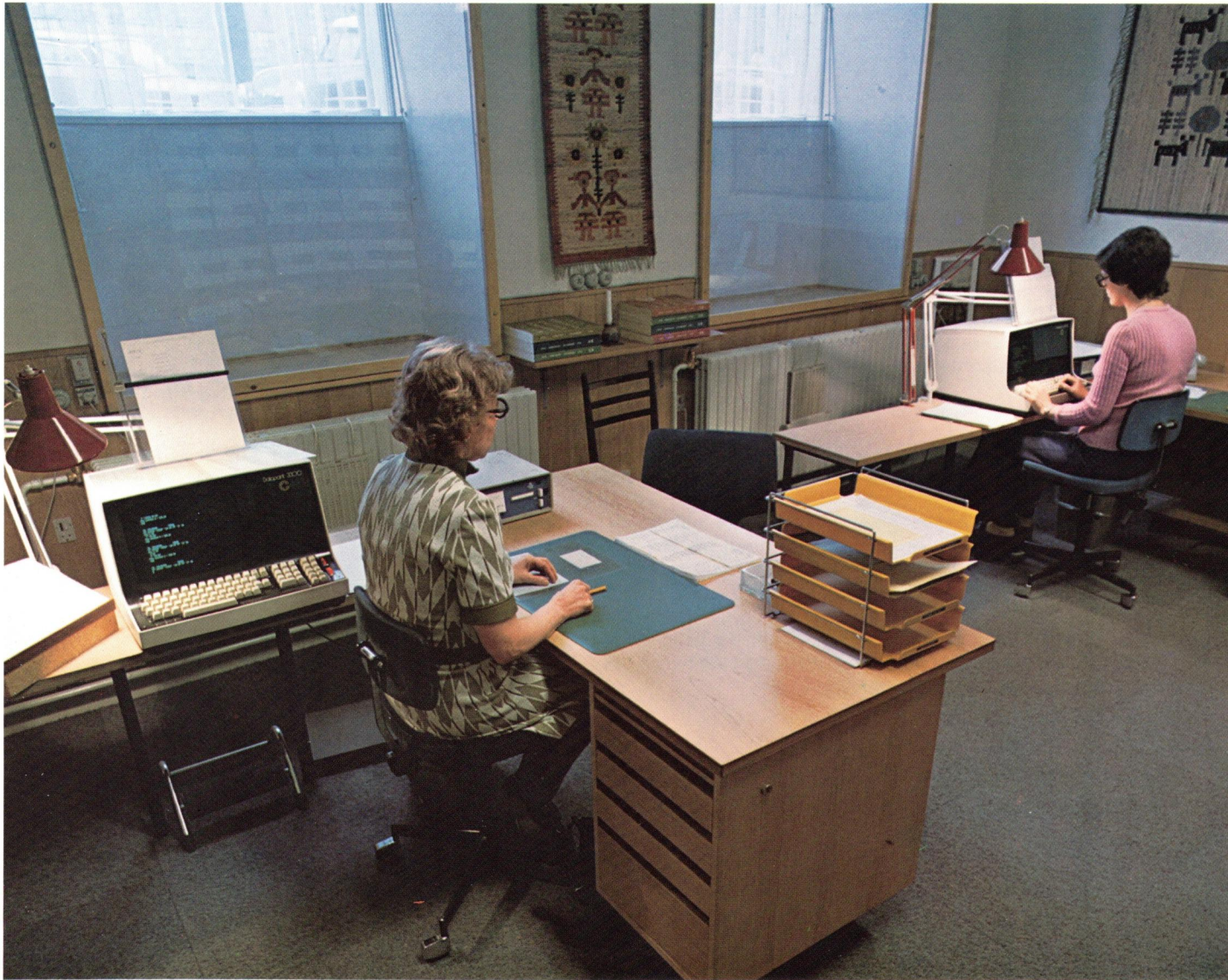
P. Brøste A/S anvender RC Teledata til on-line styring af ordrebehandling og fakturering. P. Brøste A/S uses the RC Teledata system for on-line order administration and invoicing.