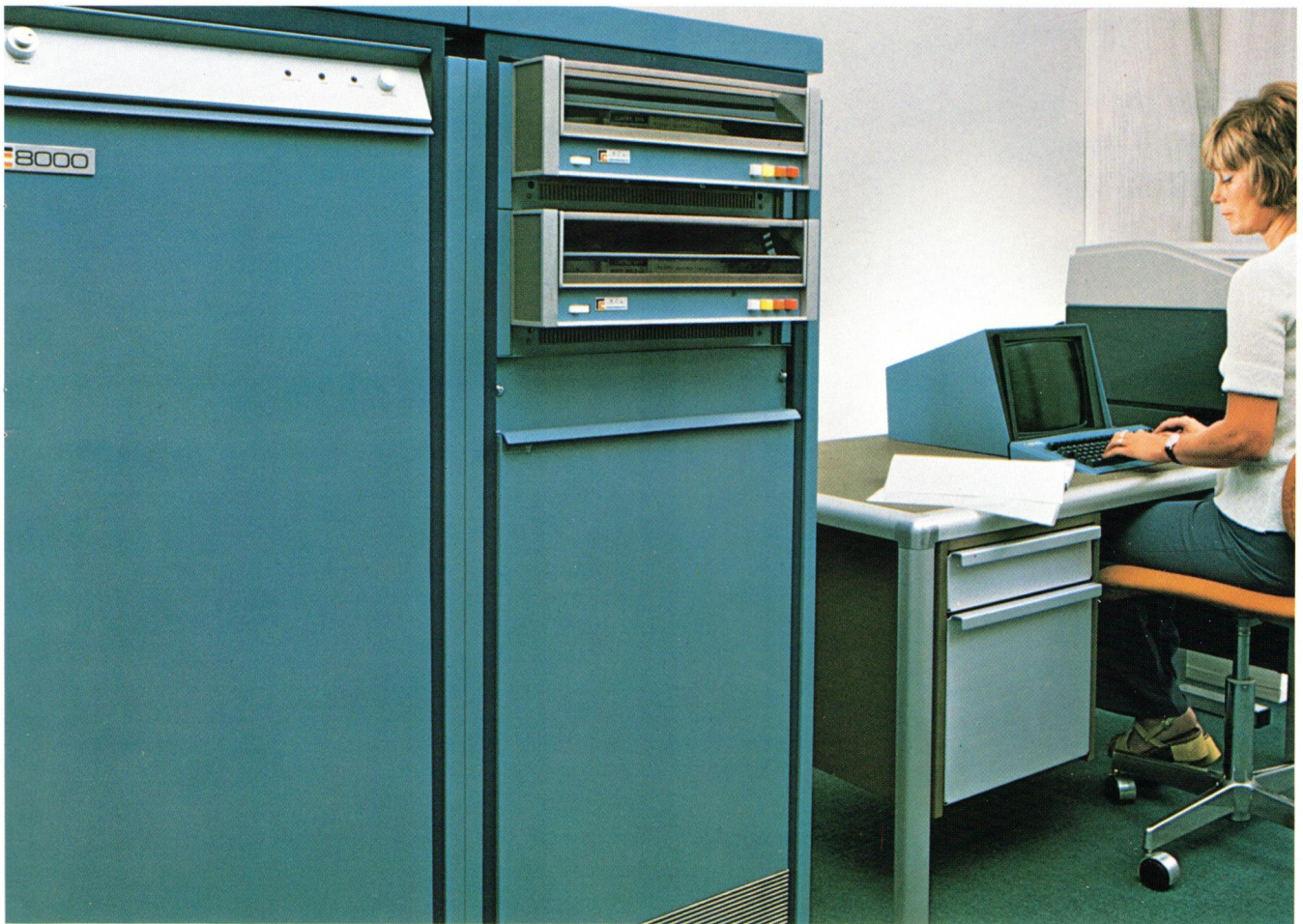
I 1975 påbegyndtes markedsføring af den nye datamat RC 8000.