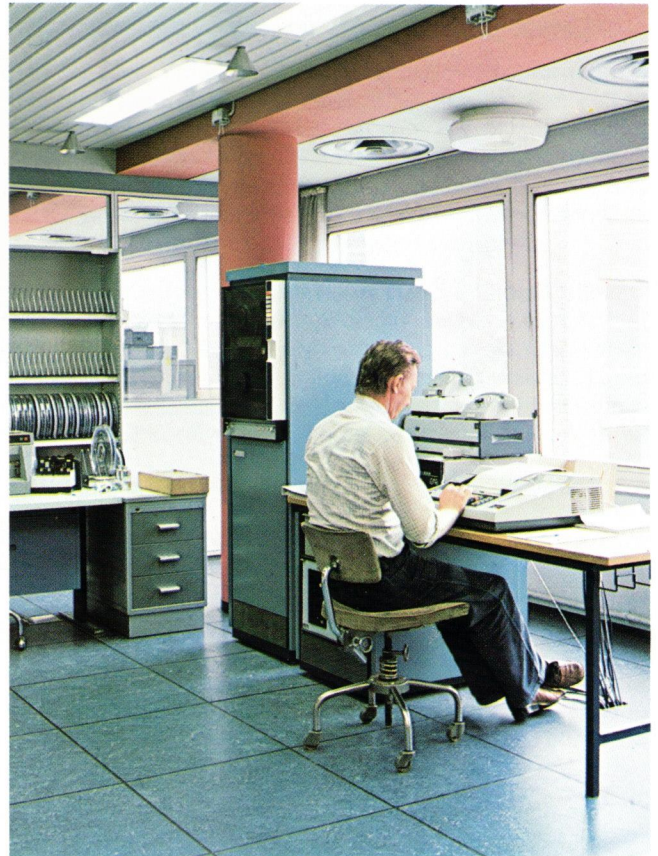
RC 3600 systemet i funktion hos A/S Dansk Shell, København. An RC 3600 support system in operation at A/S Dansk Shell in Copenhagen.