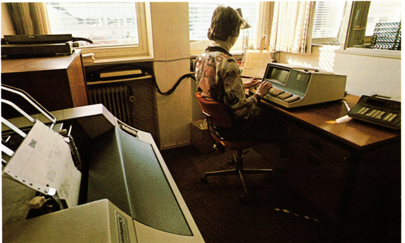
RC Teledatasystem hos A/S Erik Nielsen Kontormaskiner. An RC Teledata system at A/S Erik Nielsen Kontormaskiner.