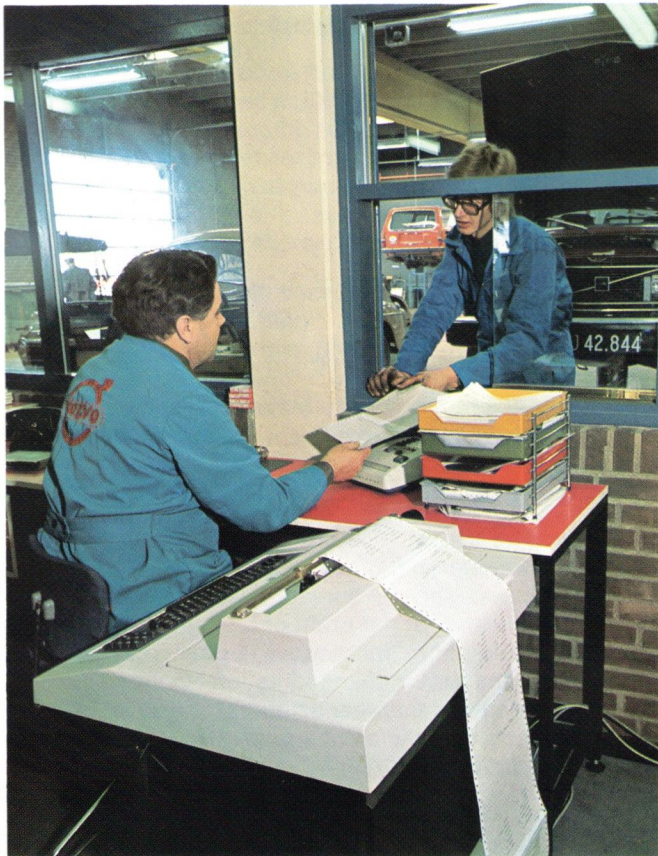
Volvo forhandlere i 11 lande anvender Datapoint 5500. Volvo dealers in 11 countries use the Datapoint 5500.