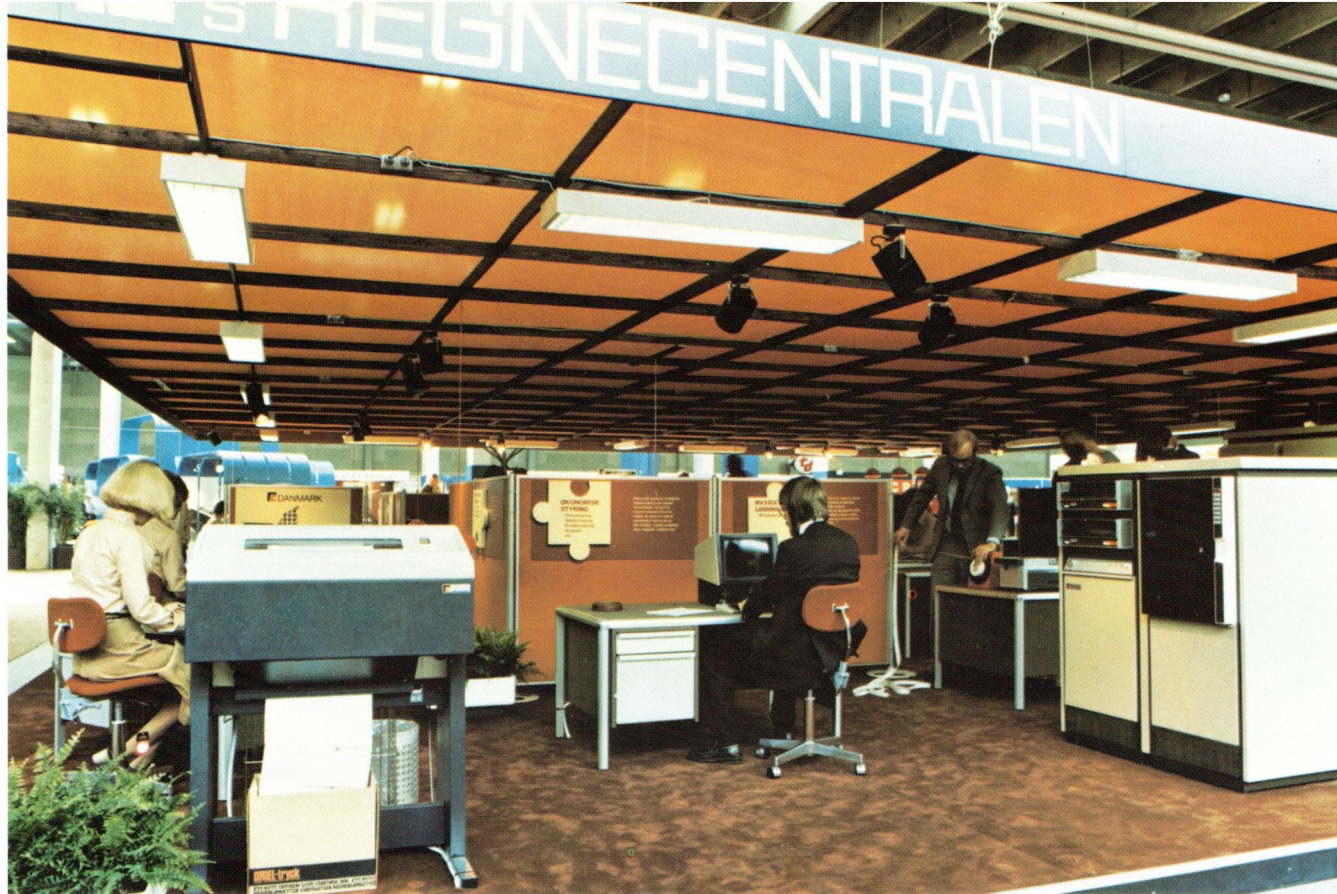
Udsnit af Regnecentralens stand på udstillingen Kontor og Data 1975.