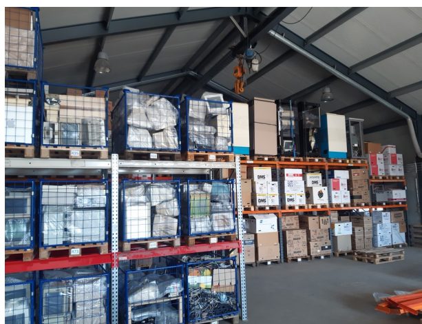
Vores magasin i Sandby ved Ringsted

Her er det planen at ha' de større og fungerende systemer, der ikke så godt tåler at blive flyttet for mange gange.