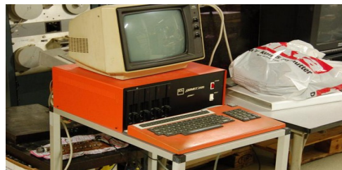
ICL Comet 3000